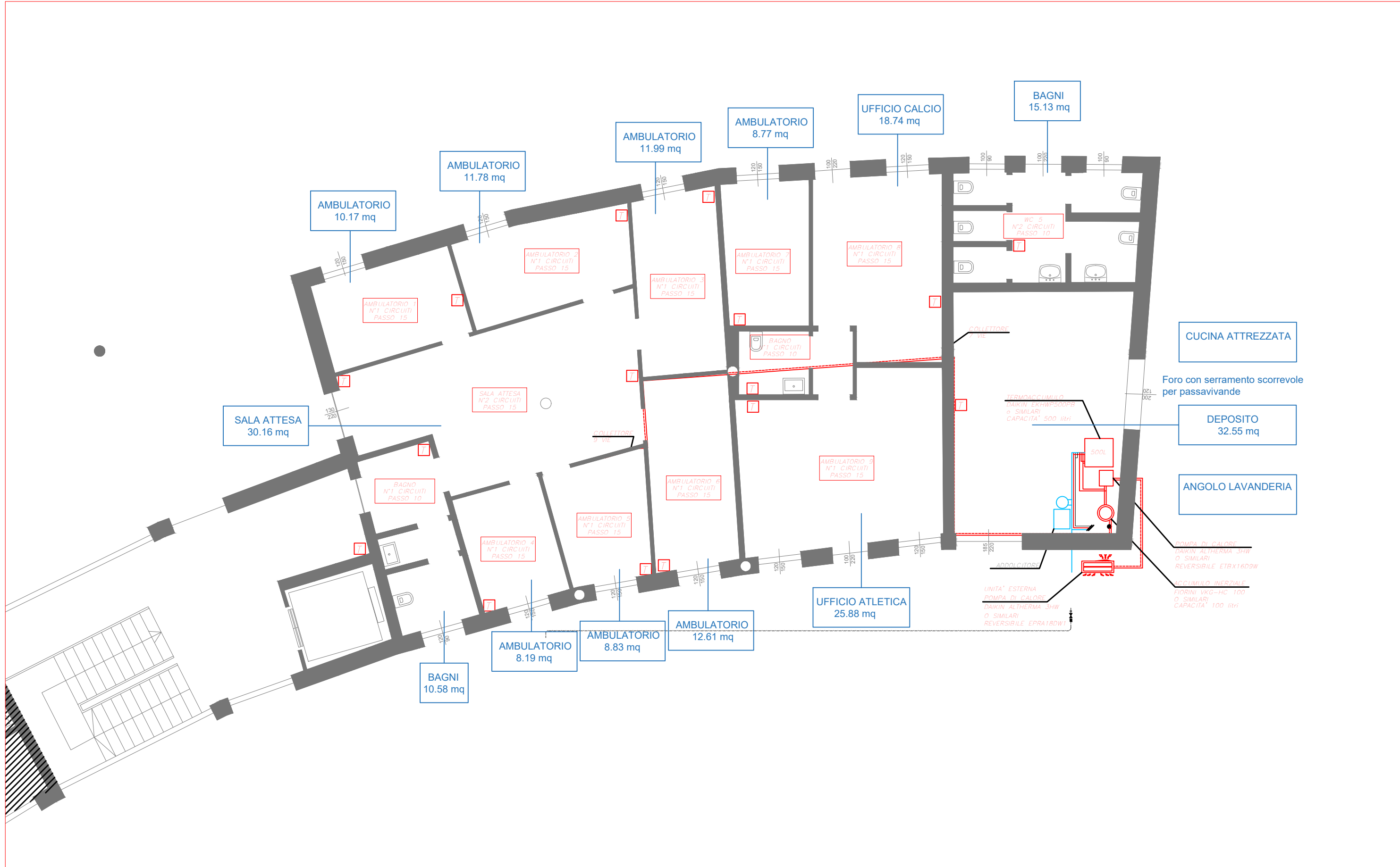
DISTRIBUZIONE IMPIANTO TERMICO